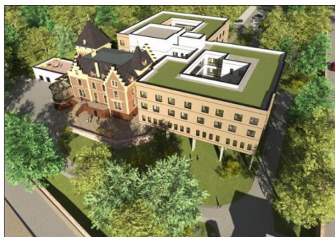
Le projet de l'Ehpad du Bois Fleuri de Guebwiller, articulé autour de l'une des villas de la famille Bourcart.