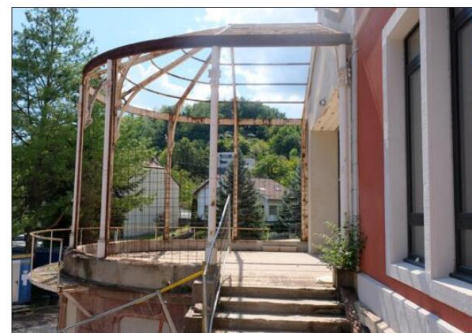
L'ancienne verrière sera restaurée, mais pas vitrée. Elle sera accessible aux résidents depuis la salle d'animation.