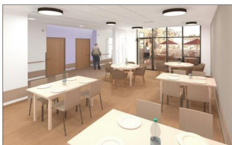
L'une des salles de restauration des unités Alzheimer. Photo L'Alsace/B + B Architectes